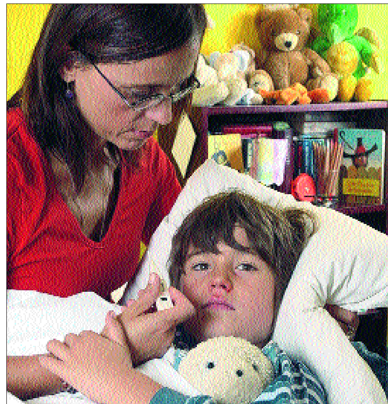
Da hilft nur Pflege: Die Grippe ist in Markdorf angekommen. Nun merken das auch die Kindergärten.

Bald können die Eltern durchatmen: Die Erzieherinnen gehen davon aus, dass das Schlimmste überstanden ist.